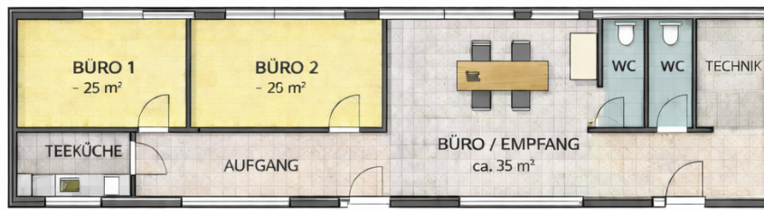
OBERGESCHOSS ca. 130 m² BÜROFLÄCHE